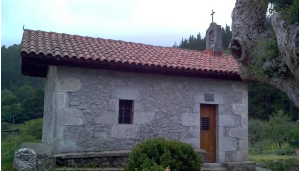
Ermita de nuestra senora del carmen gauteviz arteagako