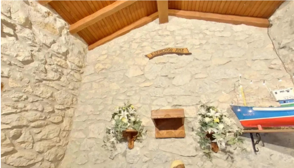
Ermita de nuestra senora del carmen opiniones