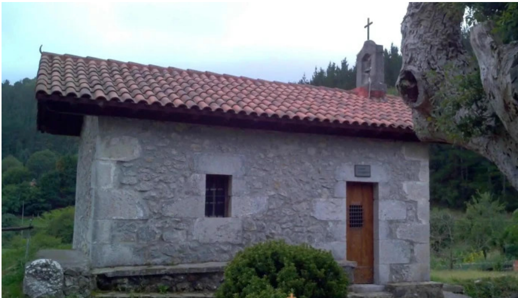
Ermita de nuestra senora del carmen capilla