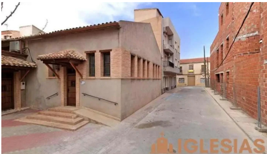
Capilla de la iglesia fuente alamo