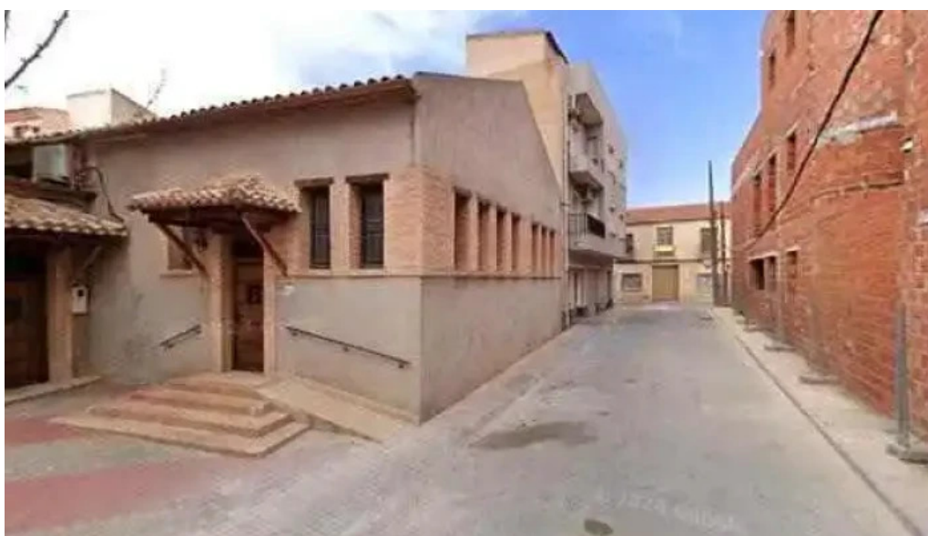
Capilla de la iglesia capilla