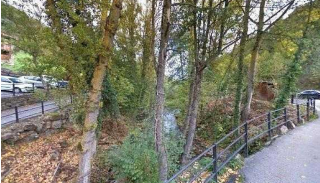
Ermita de enterría videos