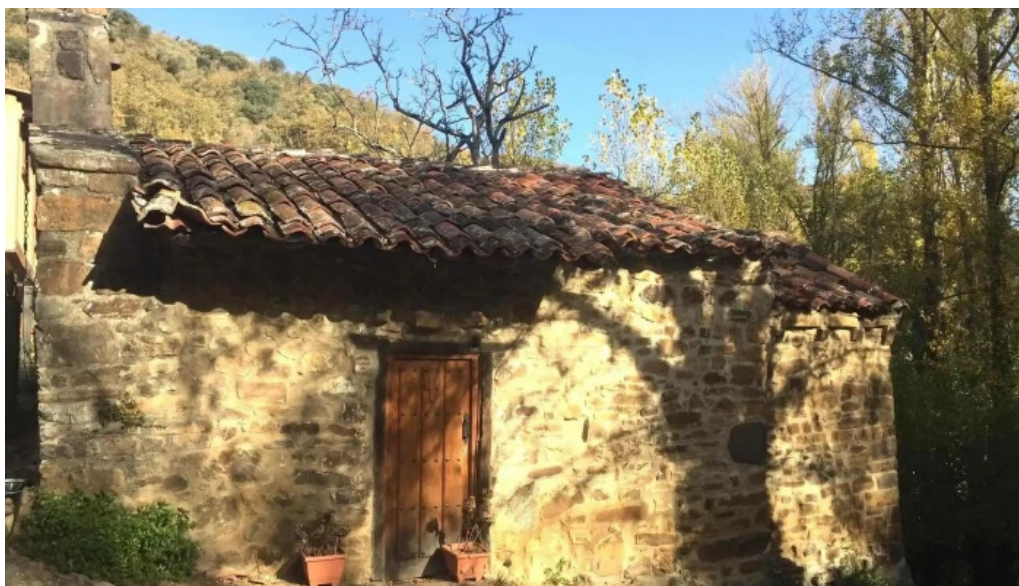
Ermita de enterría capilla