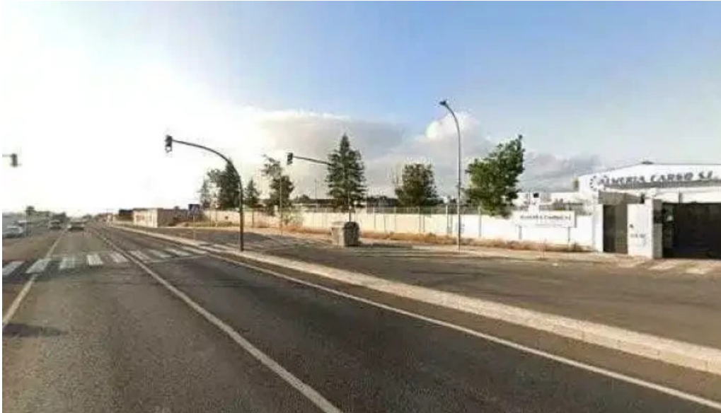
Ermita de san rafael capilla