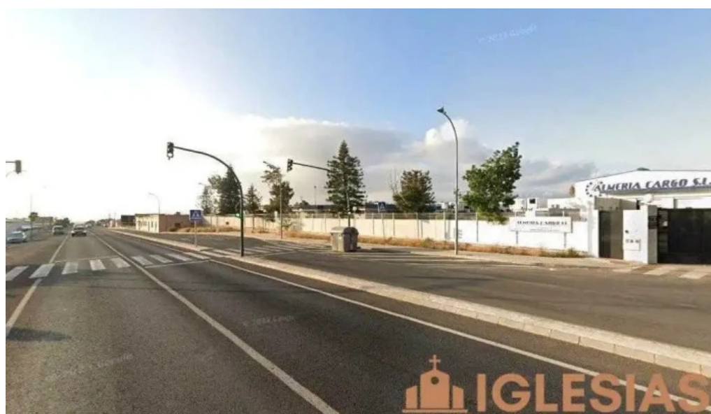
Ermita de san rafael el ejido