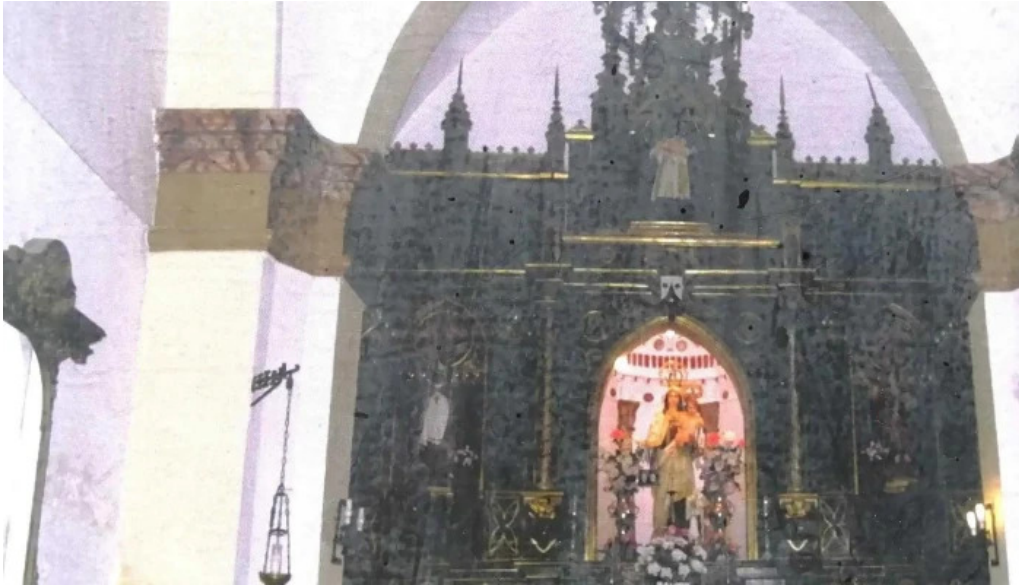
Ermita de la virgen del carmen cuevas de san marcos descuentos