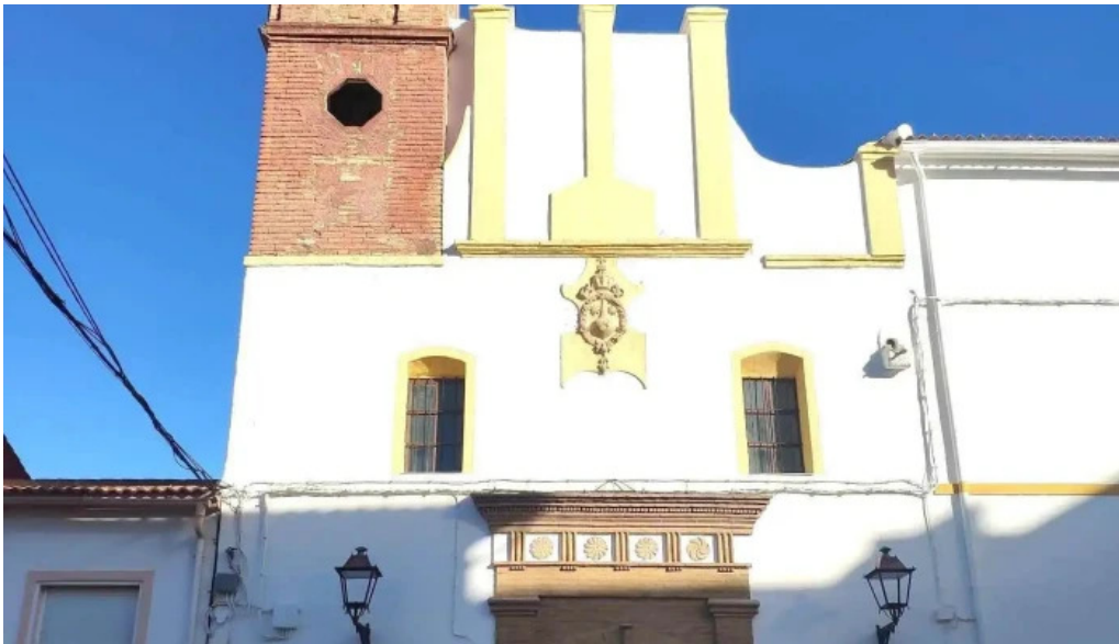
Ermita de la virgen del carmen cuevas de san marcos capilla