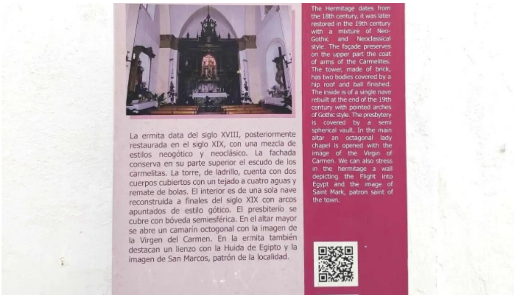
Ernita de la virgen del carmen cuevas de san marcos opiniones