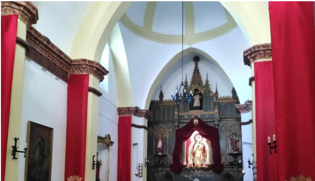
Ermita de la virgen del carmen cuevas de san marcos videos