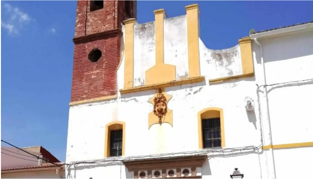
Ermita de la virgen del carmen cuevas de san marcos comentarios