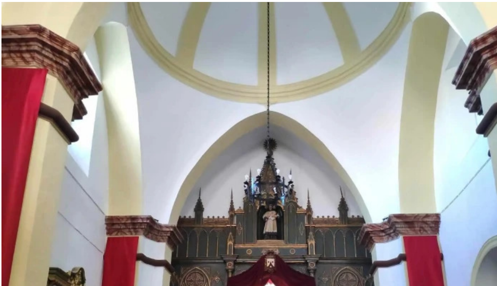
Ermita de la virgen del carmen cuevas de san marcos cuevas de san marcos