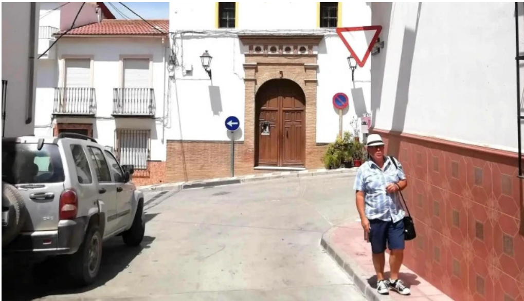
Ermita de la virgen del carmen cuevas de san marcos direccion