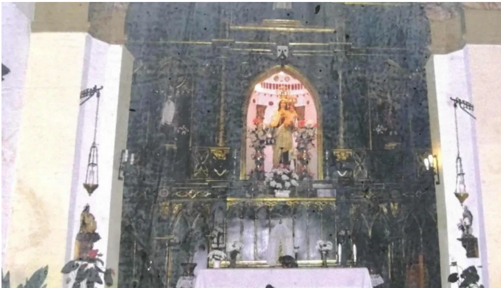
Ermita de la virgen del carmen cuevas de san marcos puntaje