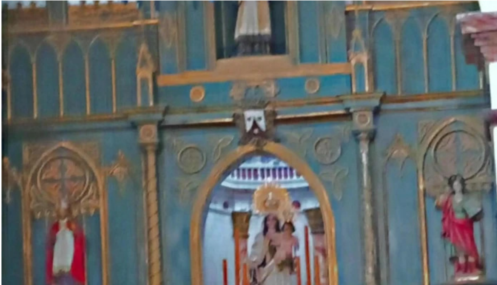
Ermita de la virgen del carmen cuevas de san marcos catalogo