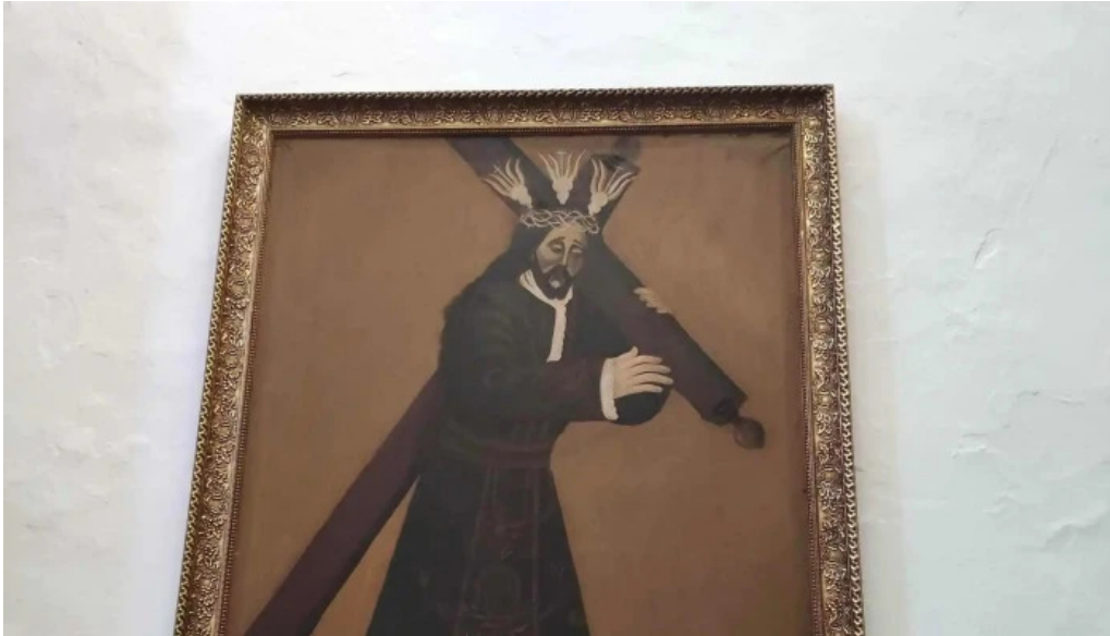
Ernita de la virgen del carmen cuevas de san marcos promocion