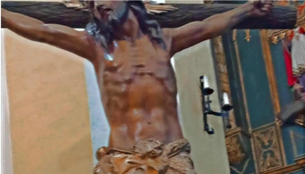
Ermita de la virgen del carmen cuevas de san marcos abierto ahora