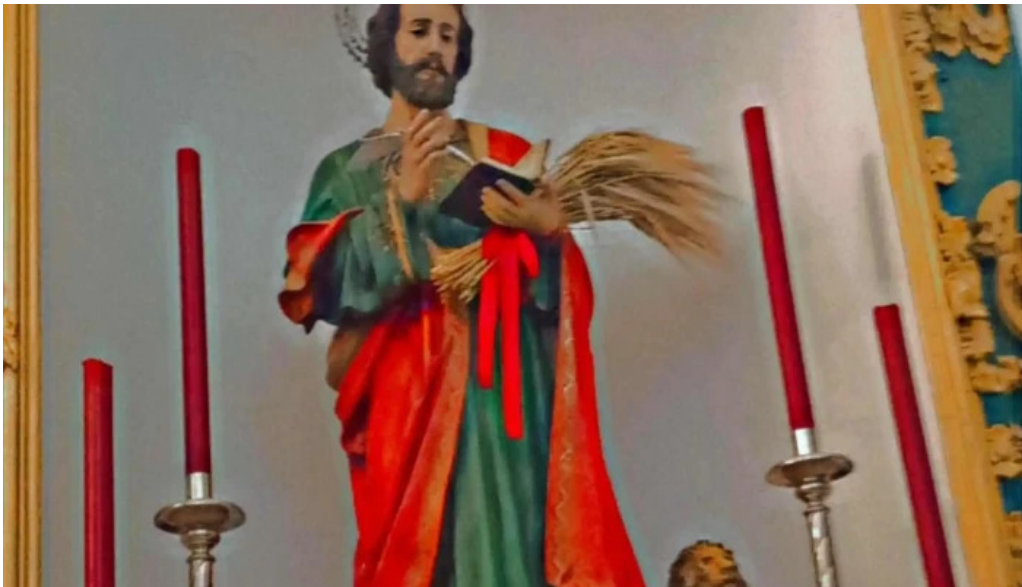
Ermita de la virgen del carmen cuevas de san marcos cerca de mi