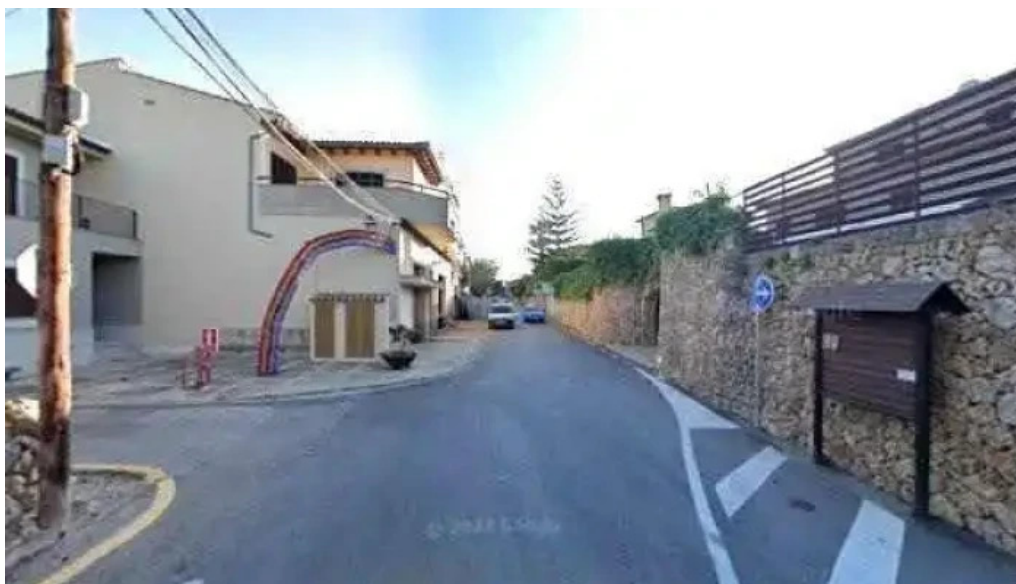
Capelleta de la mare de deu capilla