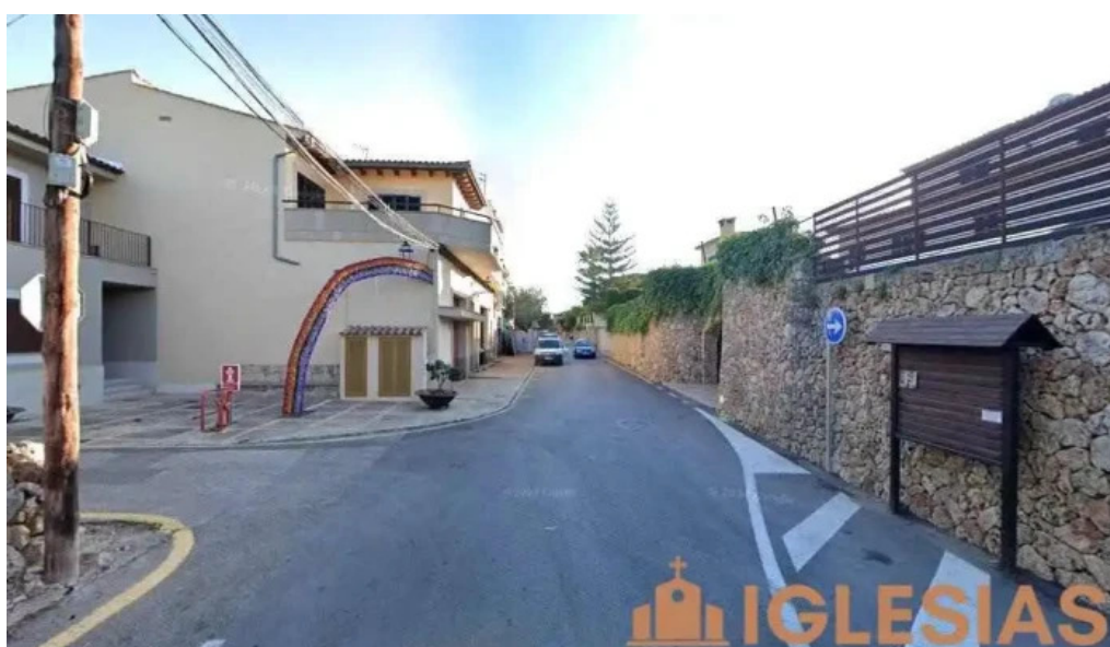
Capelleta de la mare de deu costitx