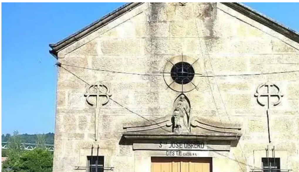
Ermita de progreso catoira