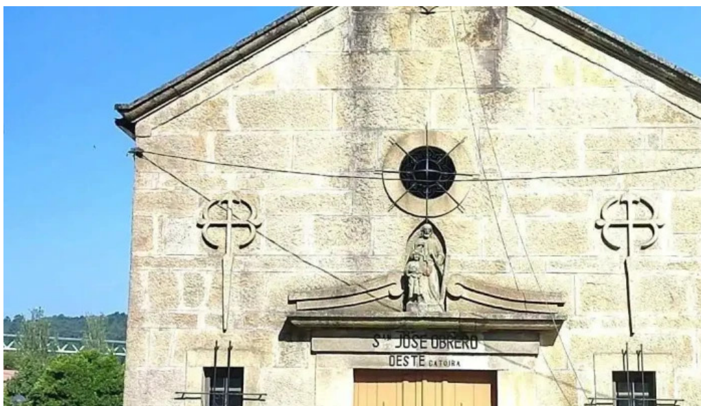
Ermita de progreso capilla