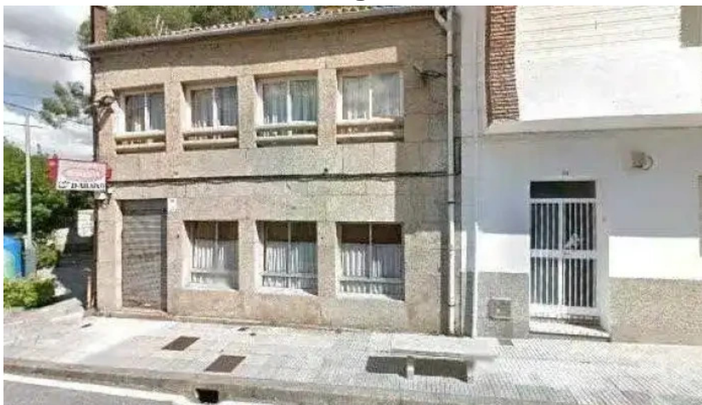
Ermita de progreso ubicacion