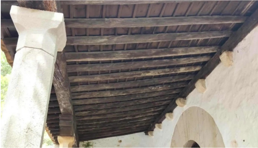
Ermita de santa anna zona