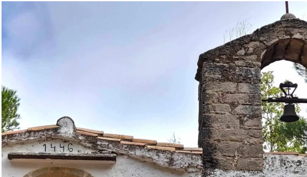
Ermita de santa anna promocion