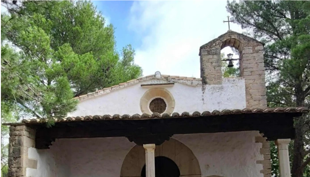
Ermita de santa anna cati