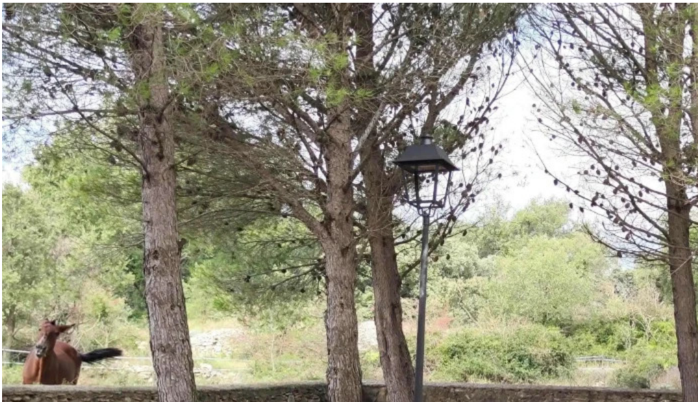
Ermita de santa anna ubicacion