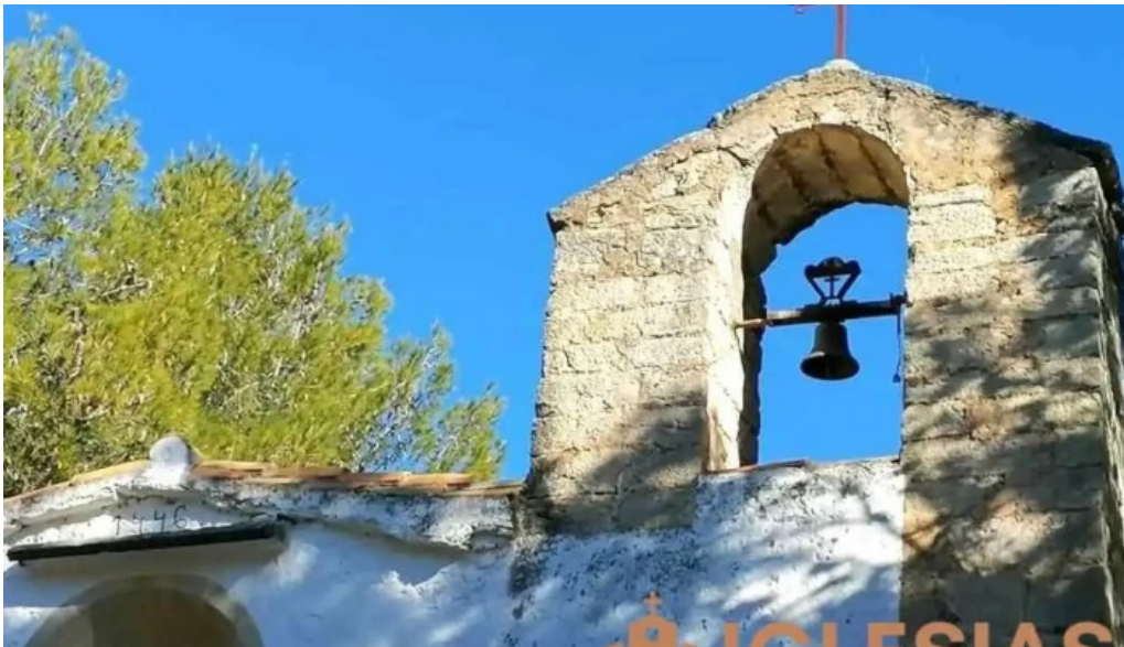
Ermita de santa anna capilla