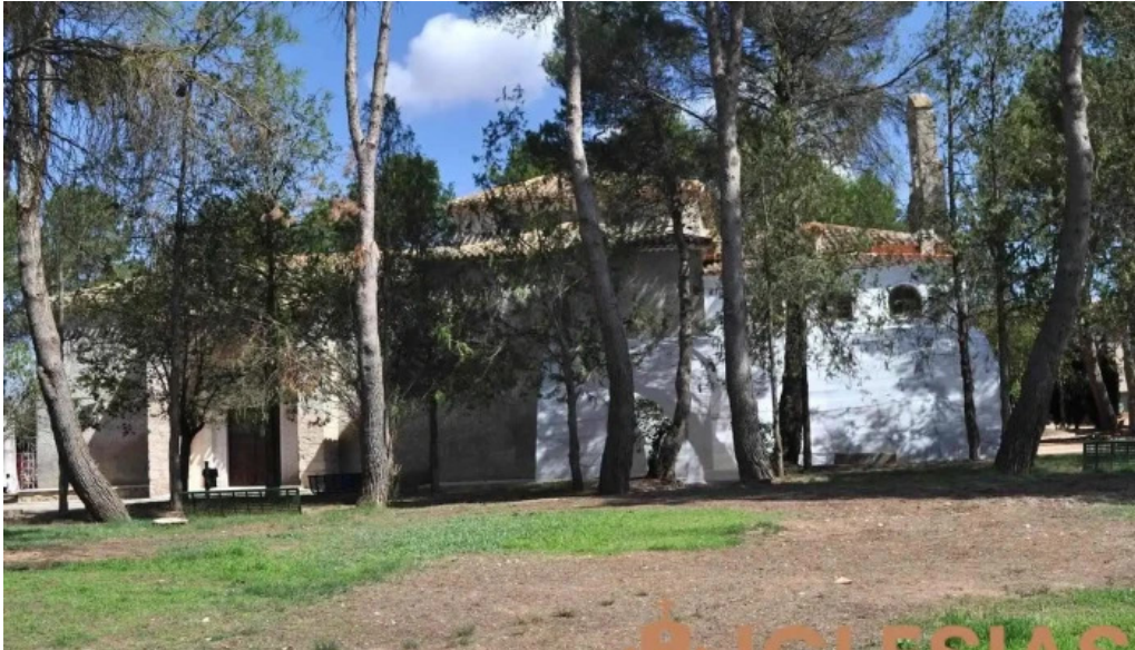
Ermita de san antonio casas de ves