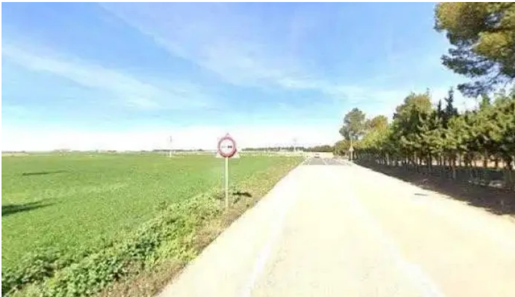
Ermita de san antonio donde