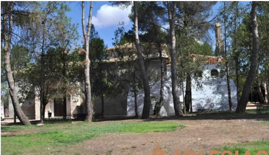
Ermita de san antonio capilla