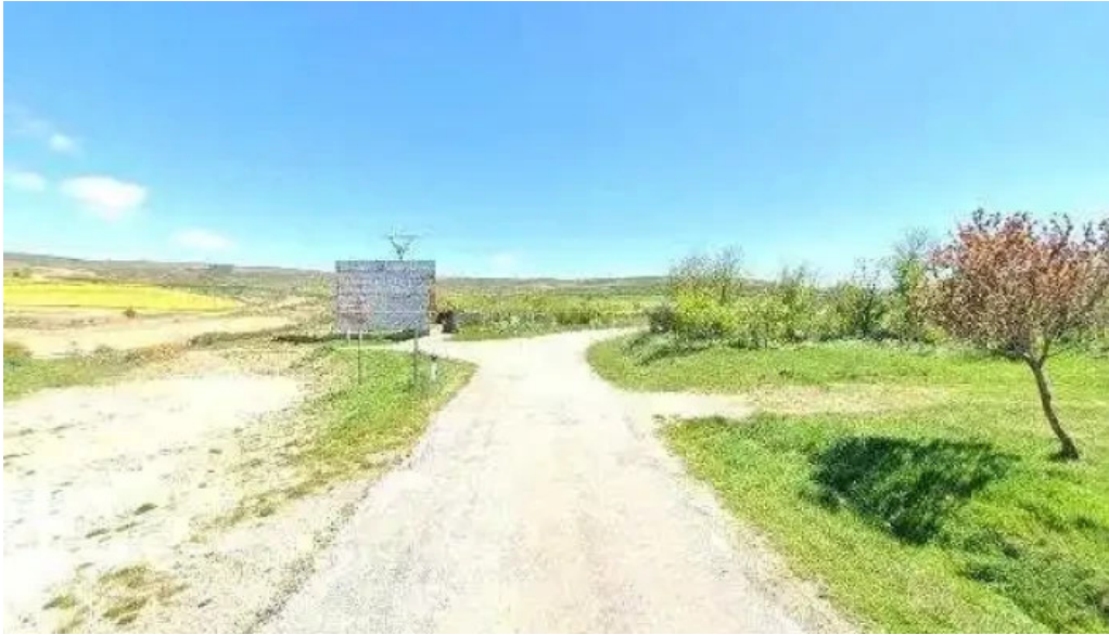
Ermita de la soledad sitio web