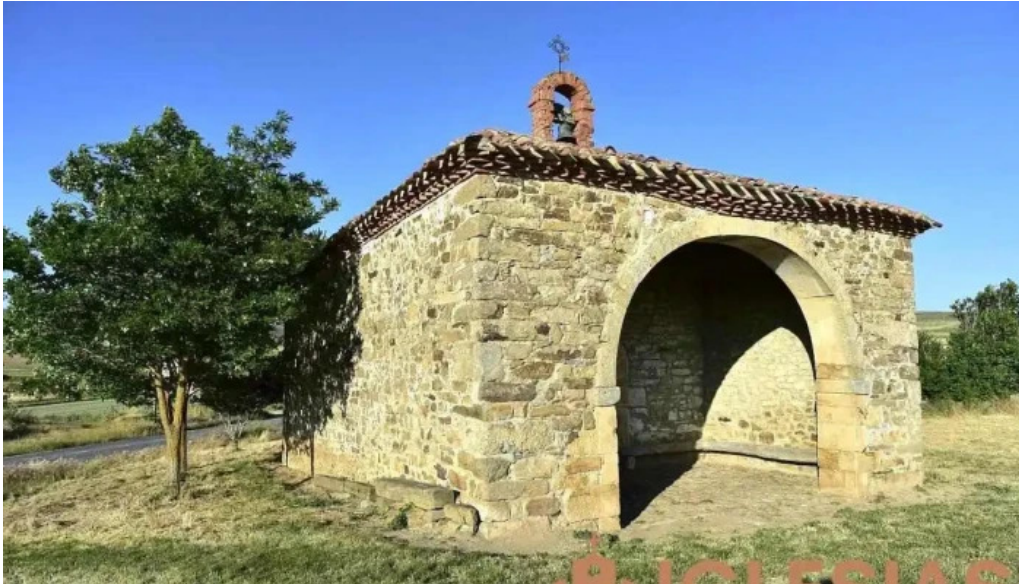
Ermita de la soledad carrascosa de la sierra