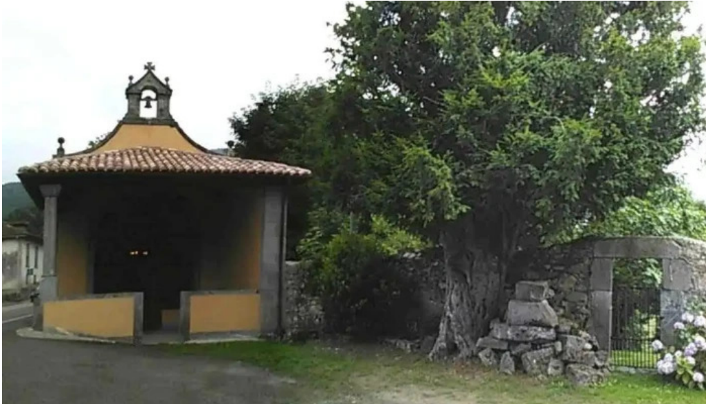
Ermita virgen de la salud capilla