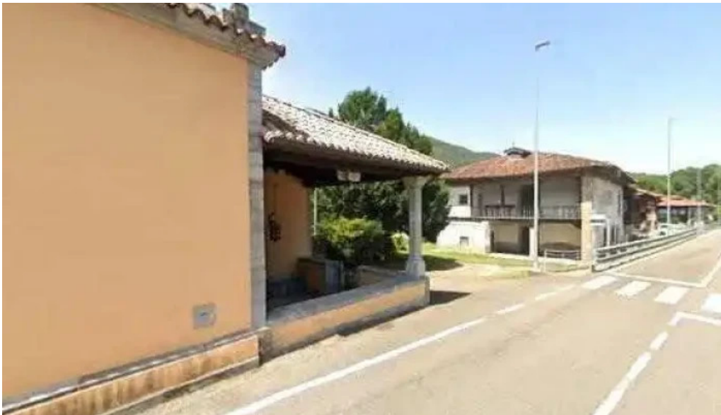
Ermita virgen de la salud cerca de mi