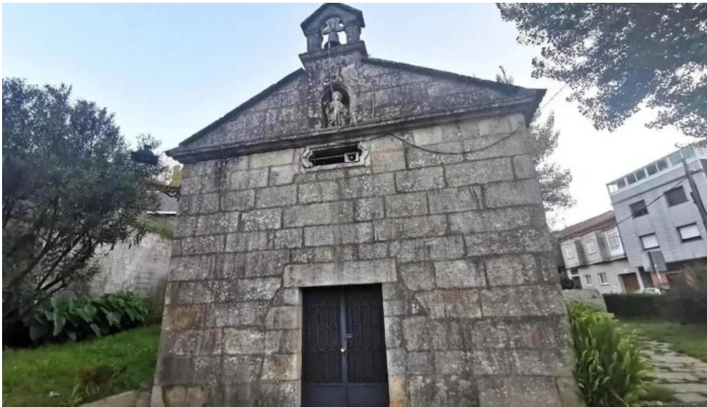
Capilla de san roque caldas de reyes