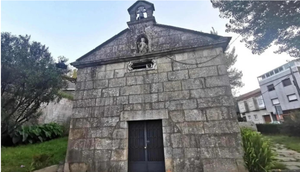
Capilla de san roque capilla