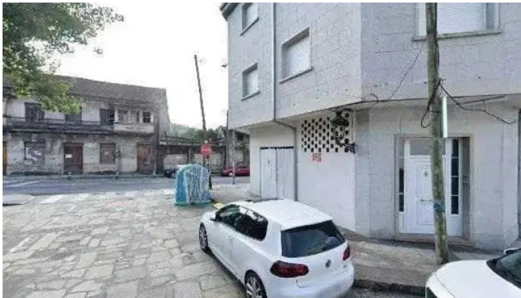
Capilla de san roque pontevedra