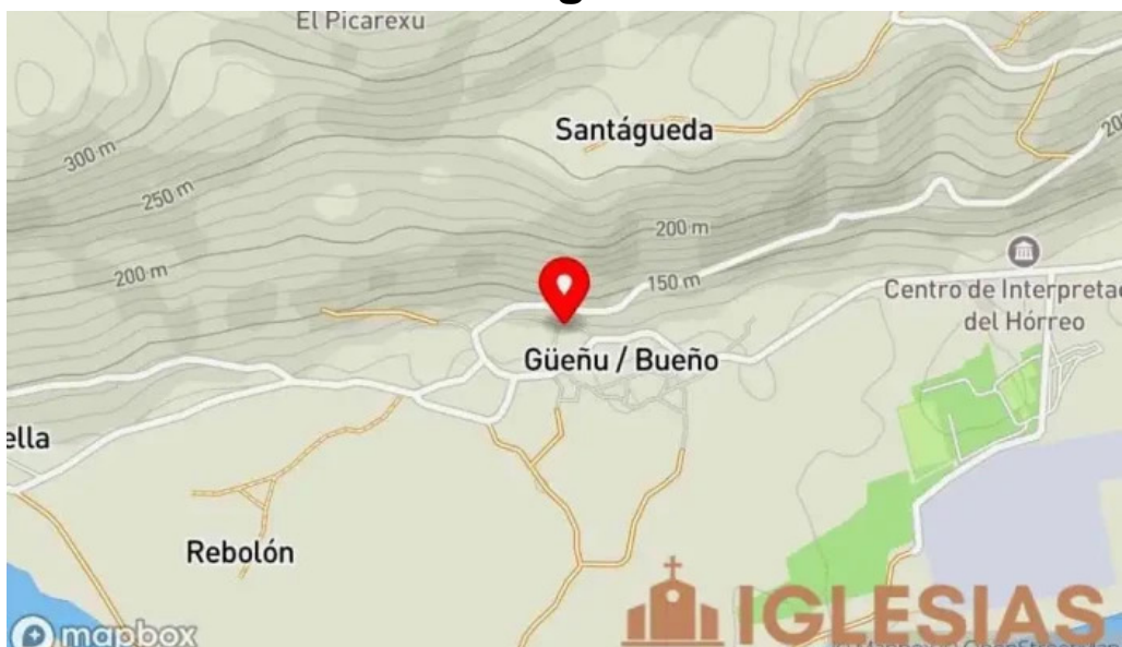
Capilla de san juan de mata de guenubueno mapa