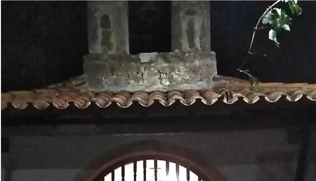
Capilla de san juan de mata de guenubueno bueno