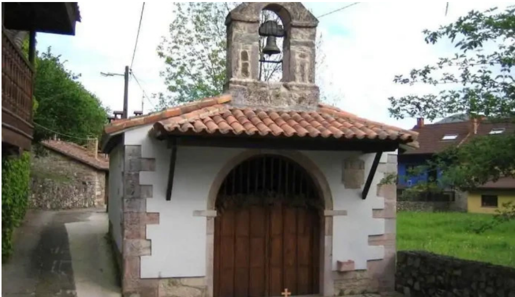
Capilla de san juan de mata de guenu bueno bueno