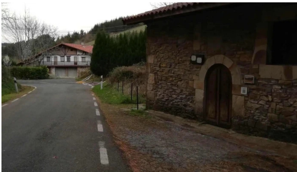
Ermita de san esteban de gerekiz biscay