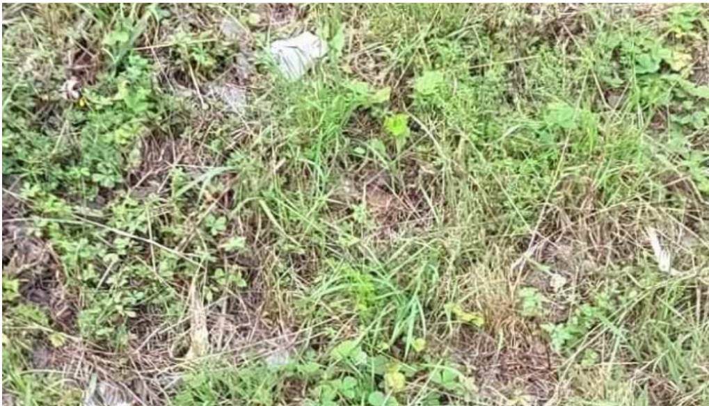
Ermita de san esteban de gerekiz videos