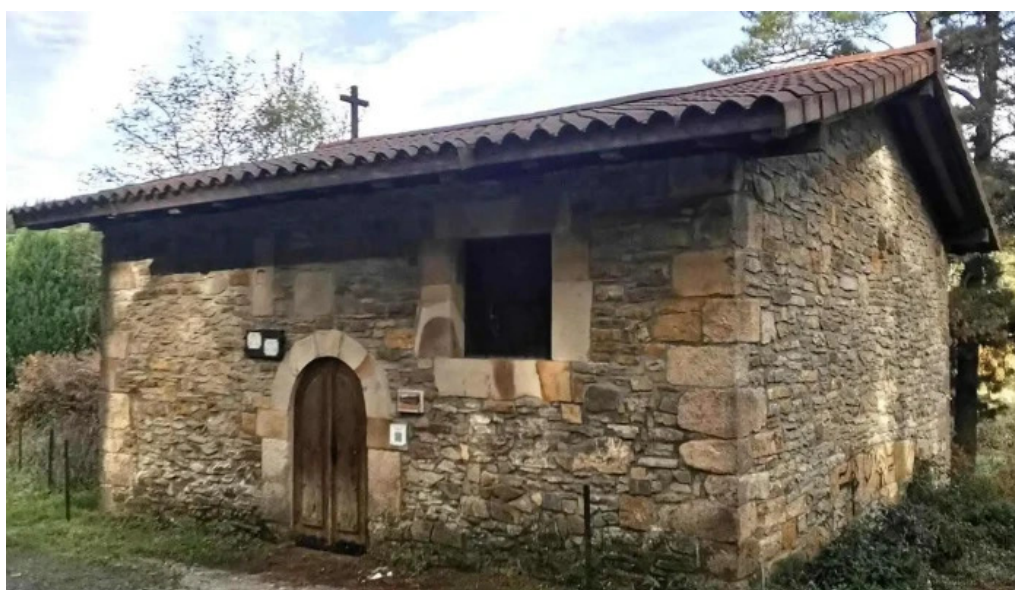
Ermita de san esteban de gerekiz capilla