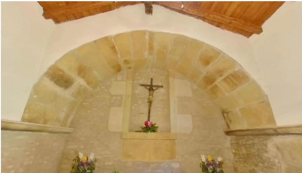
Aldakako done jakue apostoluaren baseliza ermita de santiago apostol comentarios