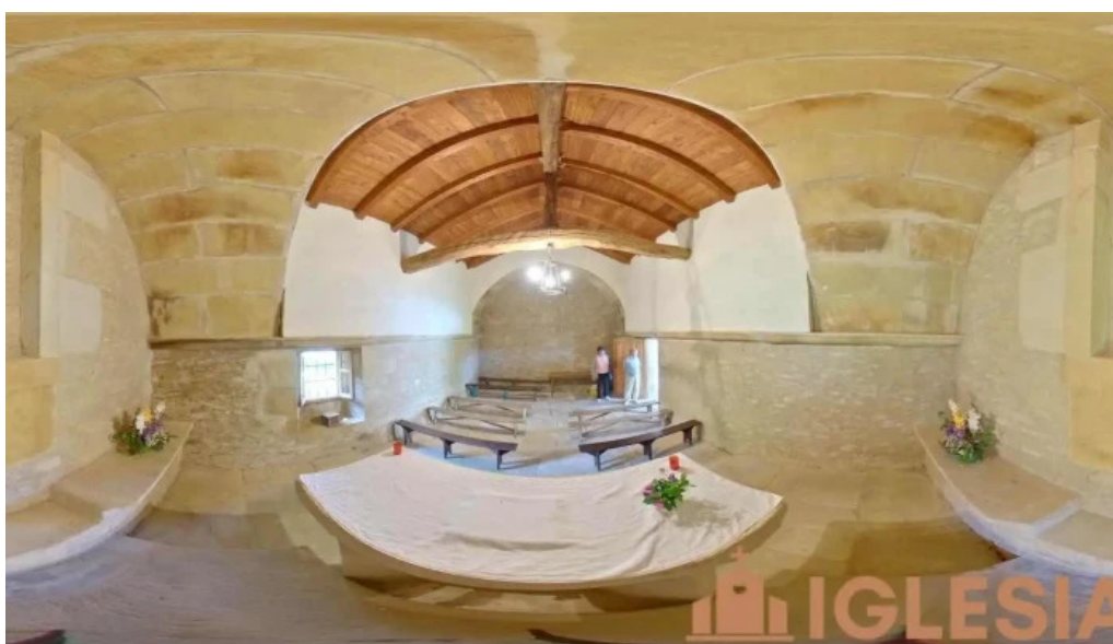
Aldakako done jakue apostoluaren baseliza ermita de santiago apostol biscay