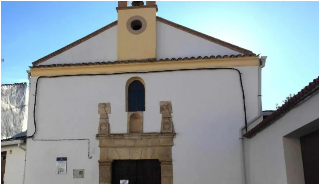
Ermita de san anton y santa lucia como llegar