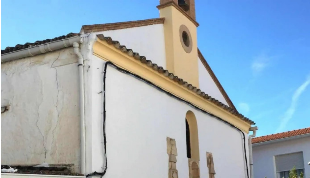
Ermita de san anton y santa lucia descuentos