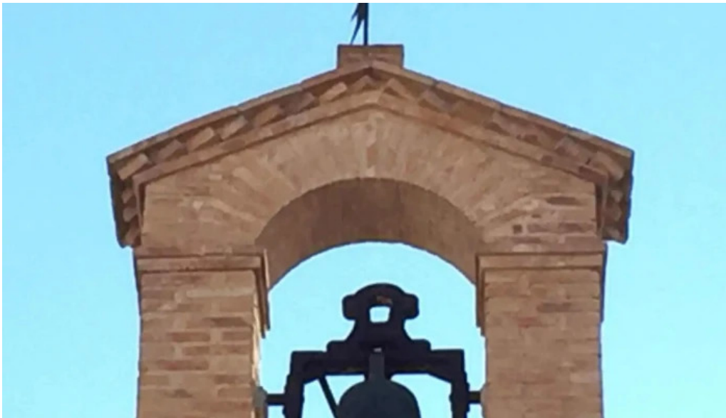
Ermita de san anton y santa lucia horario