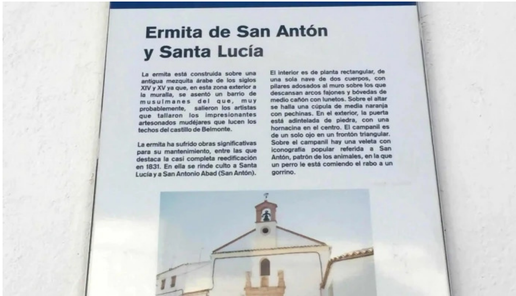
Ermita de san anton y santa lucia puntaje