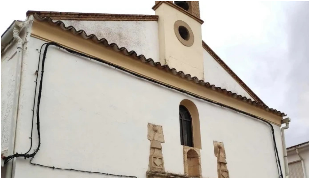
Ermita de san anton y santa lucia belmonte