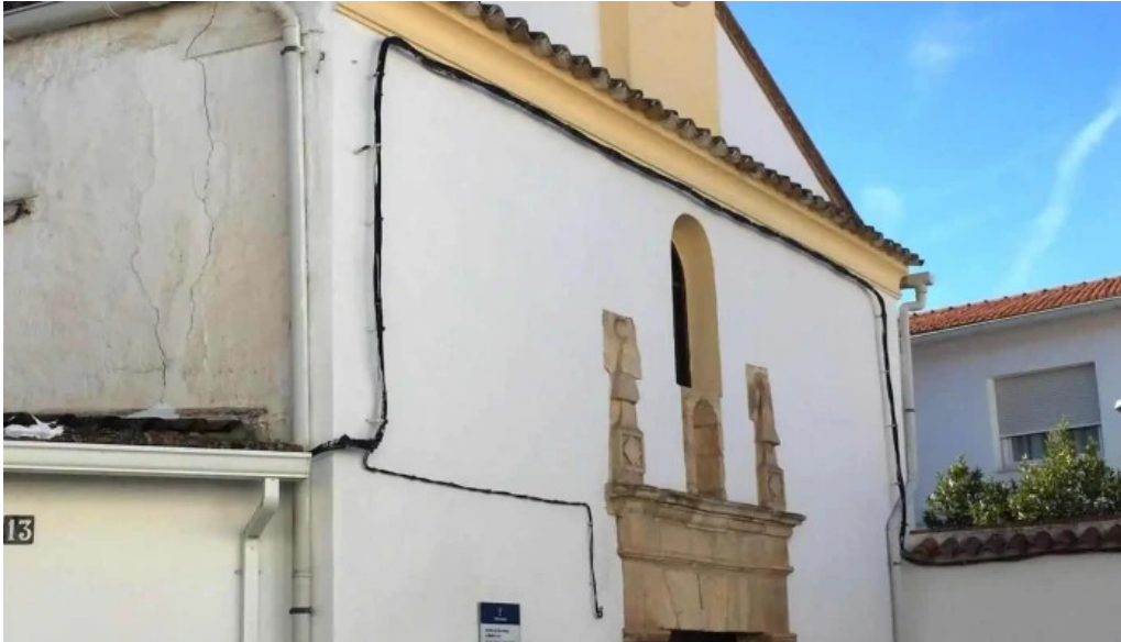
Ermita de san anton y santa lucia capilla