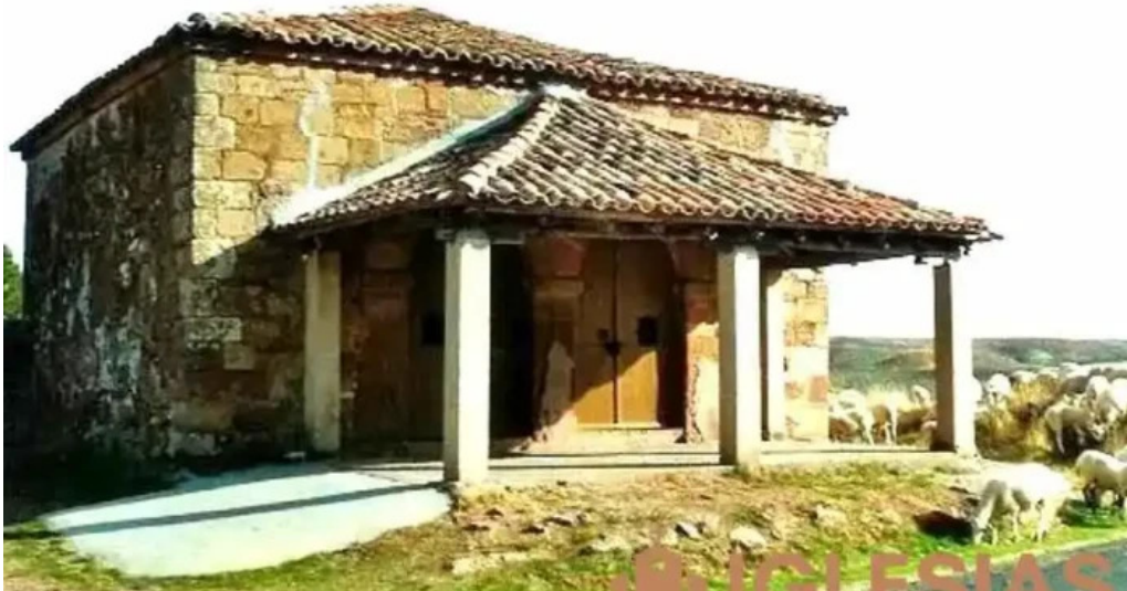
Ermita de barcones barcones