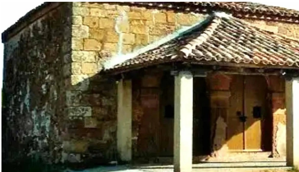
Ermita de barcones comentario 2