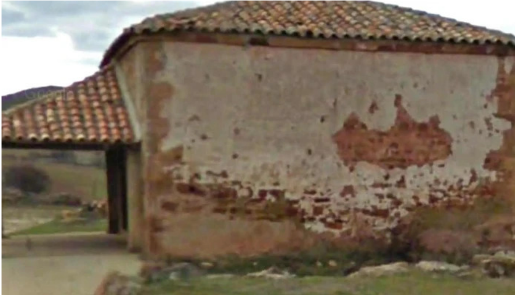
Ermita de barcones comentario 1