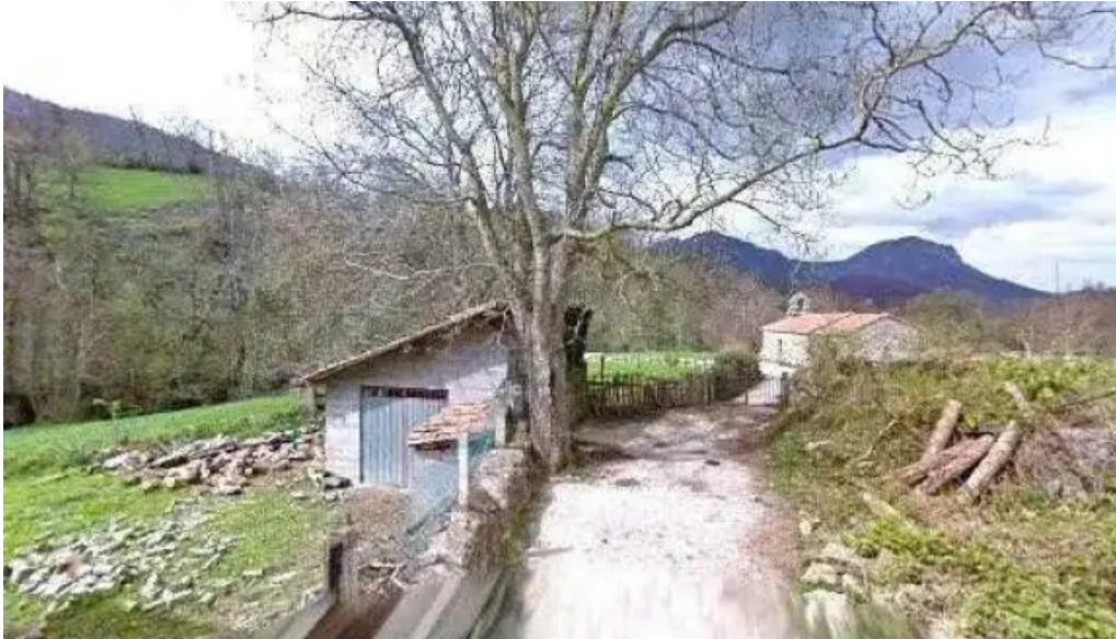
Ermita de san pedro capilla