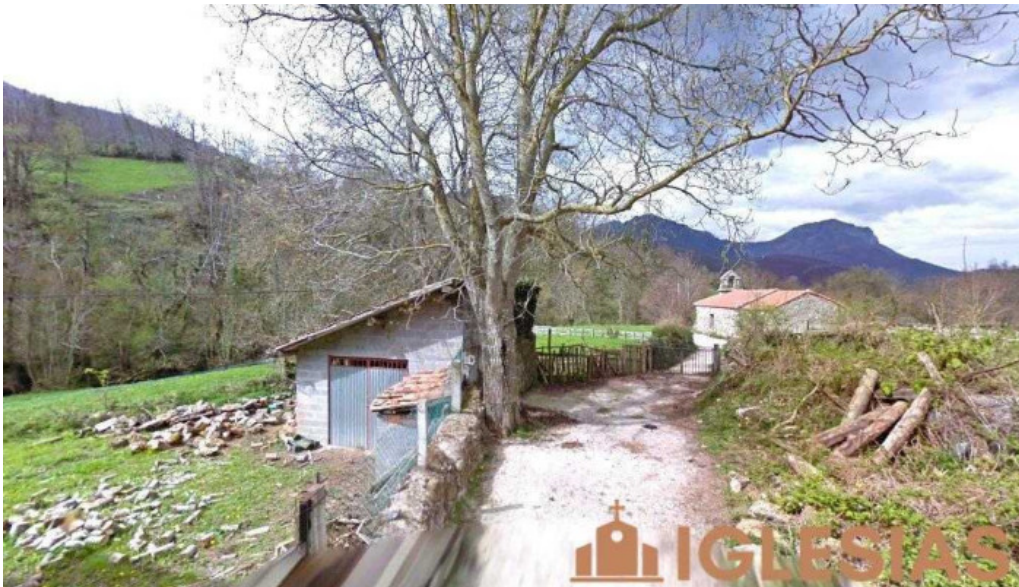
Ermita de san pedro asturias