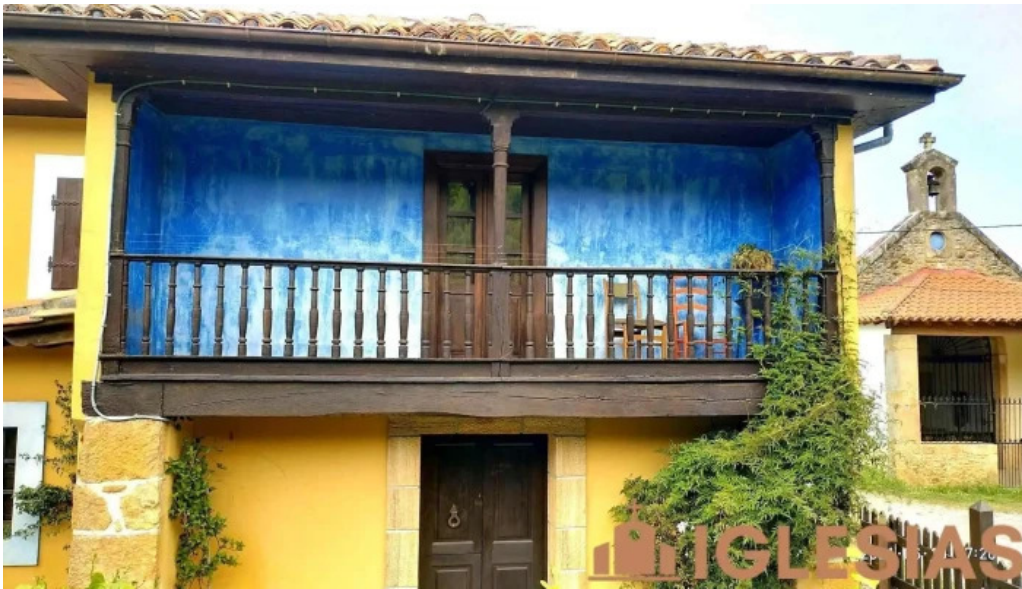
Ermita de san jose capilla