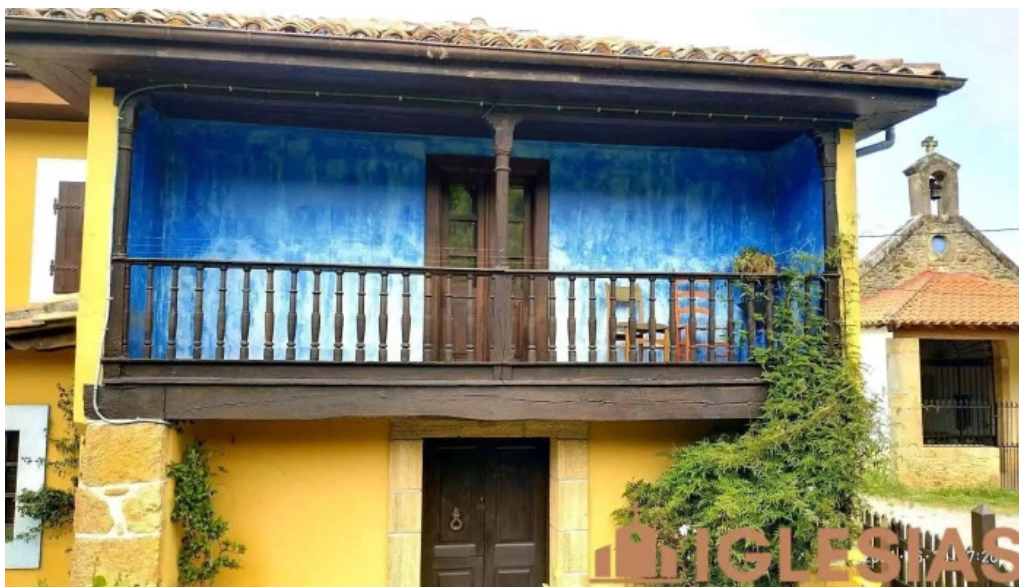
Ermita de san jose asturias