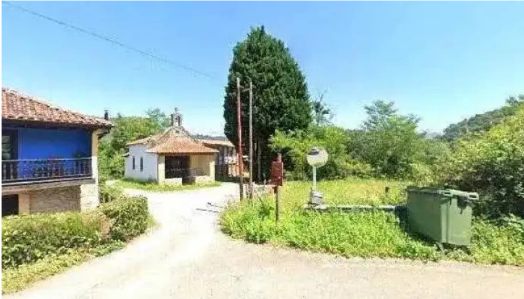
Ermita de san jose instagram