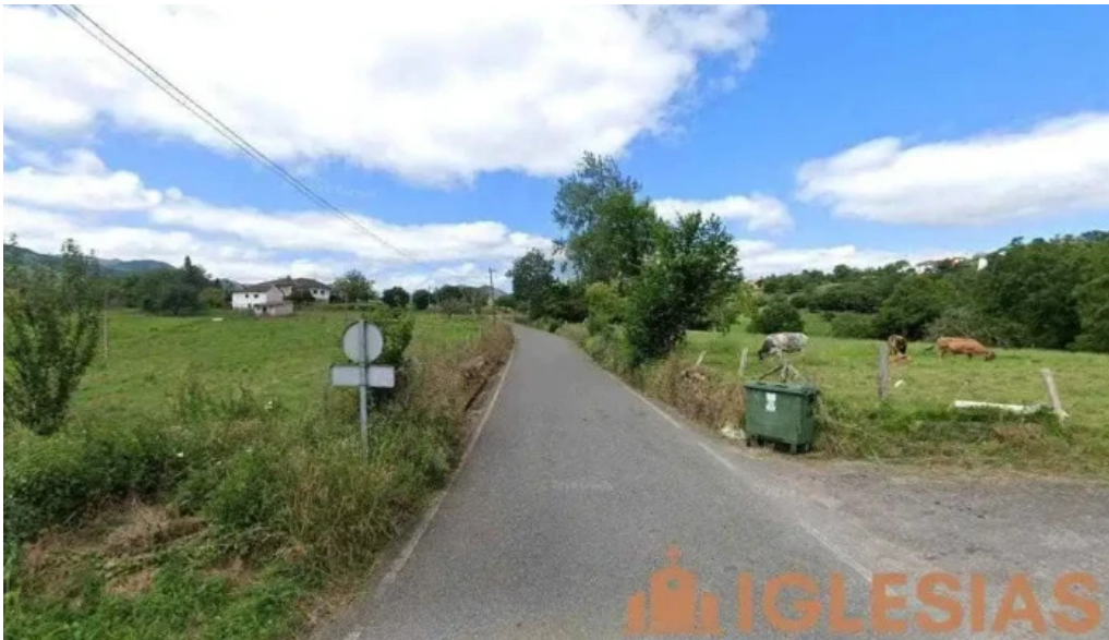
Capilla de san roque asturias