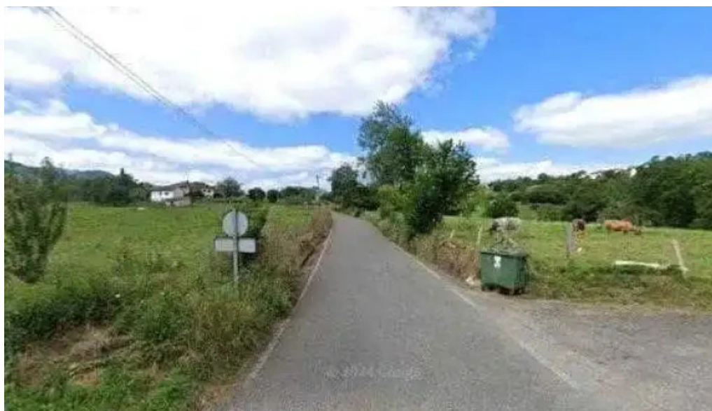
Capilla de san roque capilla