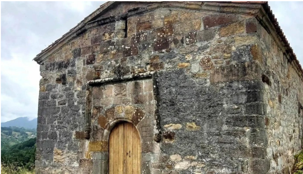
Capilla de san martin de escoto abierto ahora