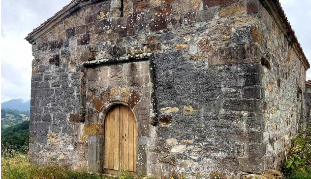
Capilla de san martin de escoto comentarios