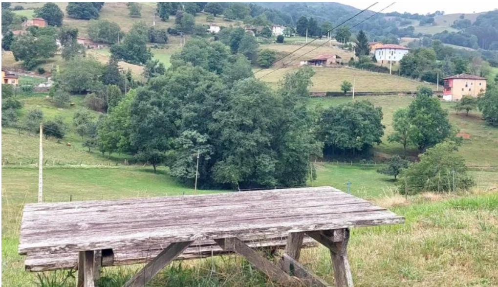
Capilla de san martin de escoto zona