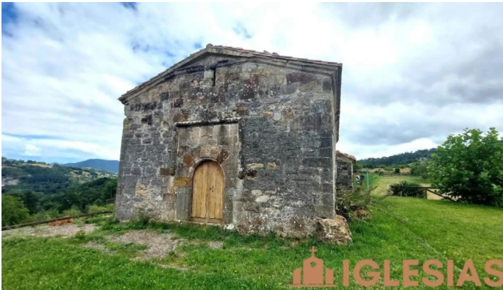
Capilla de san martin de escoto capilla