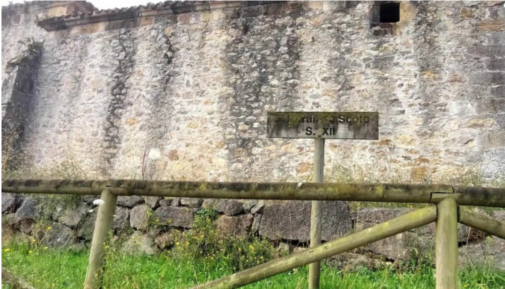
Capilla de san martin de escoto asturias