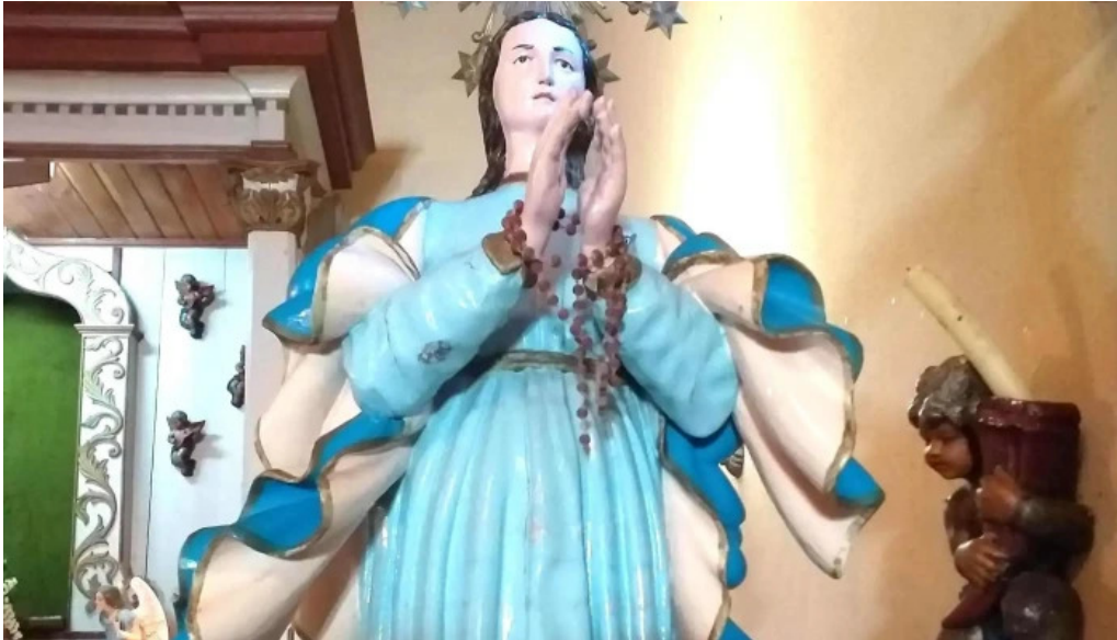
Capilla de la ascension as neves