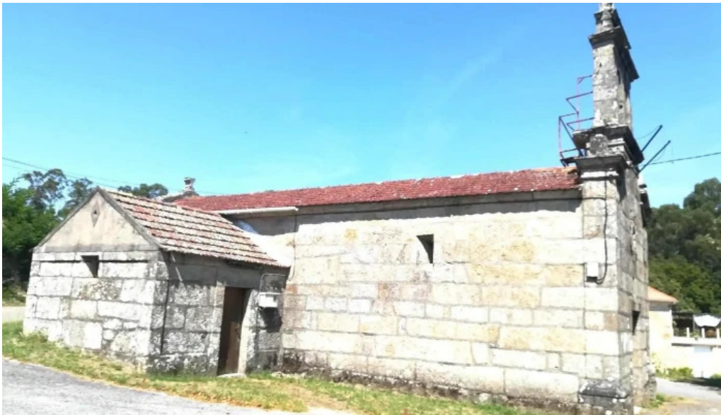
Capilla de la ascension capilla