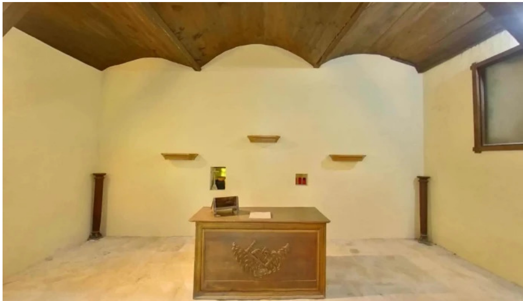
Ermita de san pedro apostol de arta como llegar