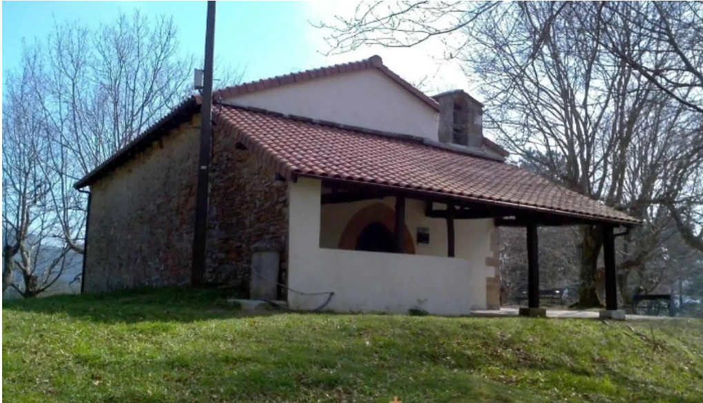
Ermita de san pedro apostol de arta capilla