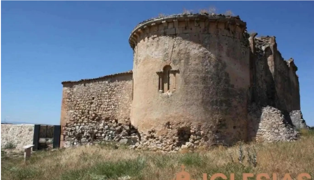
Ermita de san lorenzo ruinas capilla