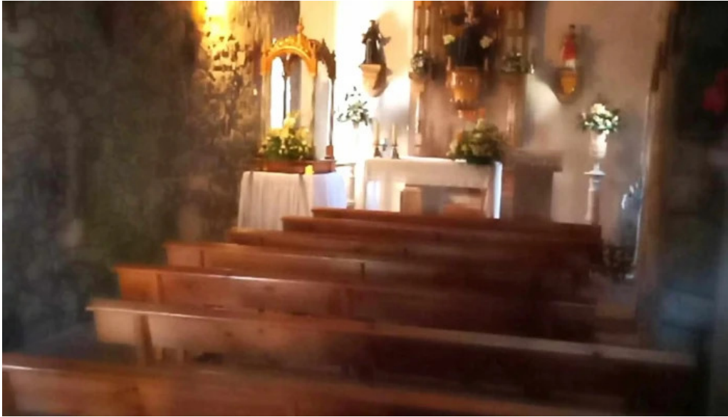
Capilla de san antonio comentario 3