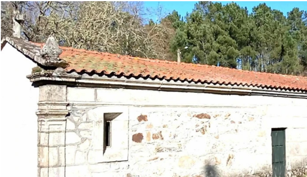
Capilla de san antonio comentario 2