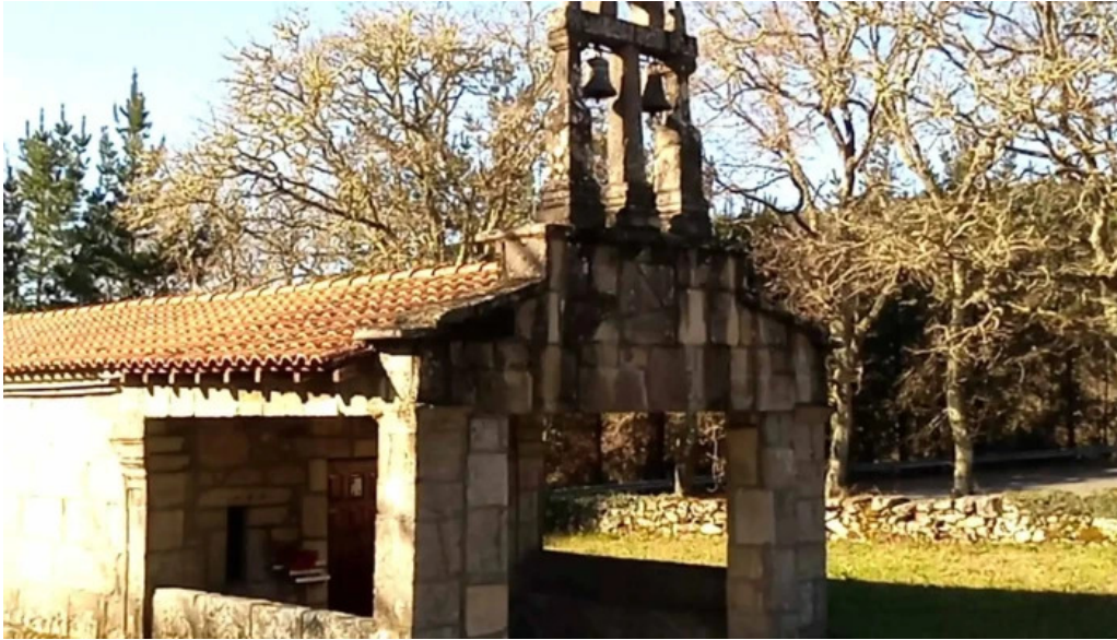
Capilla de san antonio comentario 1