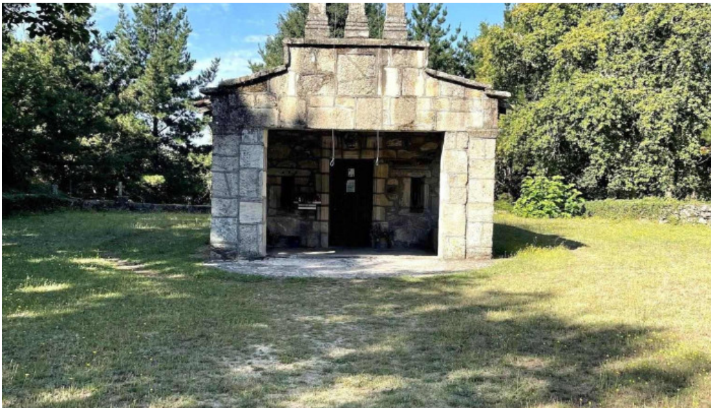
Capilla de san antonio antonio