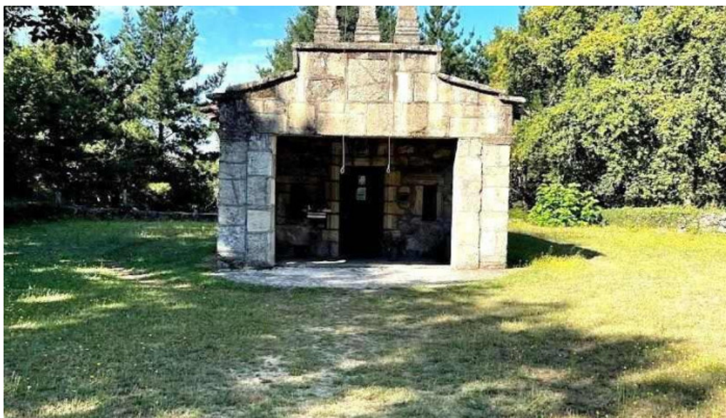
Capilla de san antonio a casanova