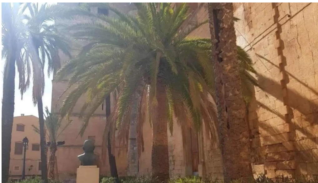
Esglesia de muro atraccion turistica