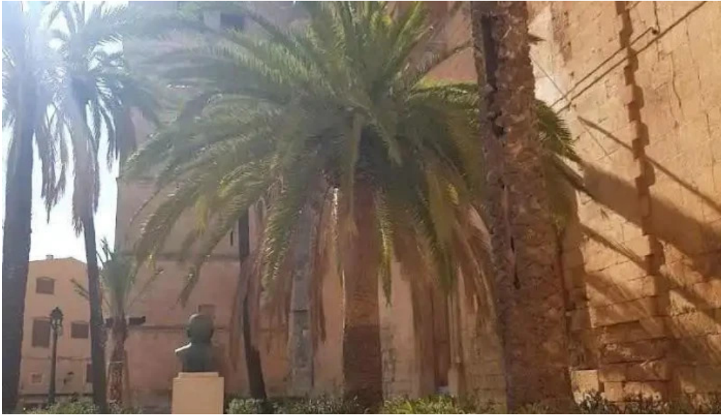
Esglesia de muro muro