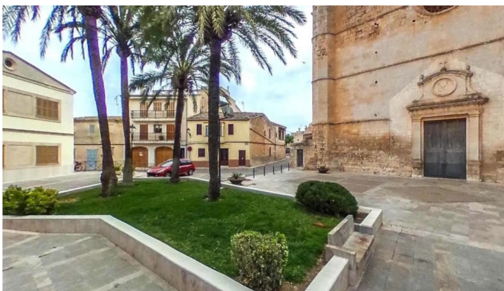
Esglesia de muro abierto ahora