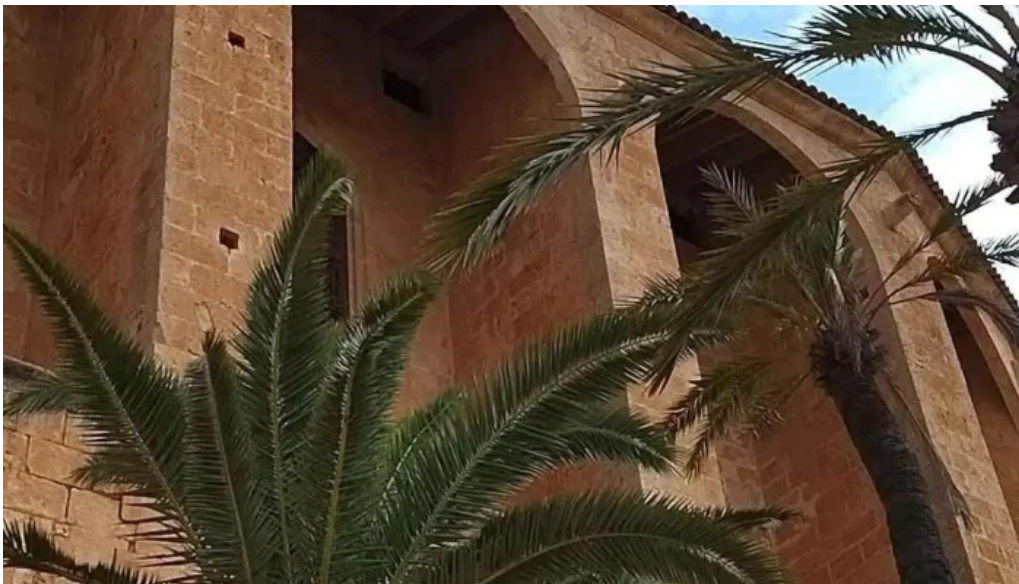
Esglesia de muro videos